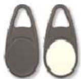
RFID Transponder – přívěšek na klíče

Pro každého uživatele na zámku (Uživatelé 1-9) může být na zámku přiřazena jedna čipová karta případně RFID přívěšek na klíče pro další dodatečnou identifikaci uživatele.