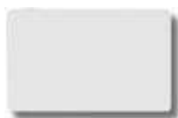
RFID Transponder - čipová karta

Varianta pro RFID obsahuje všechny funkce zámku CombiStar 7250pro rozšířené o další identifikaci pomocí bezkontaktního transpondéru (např. čipové karty) po zadání normálního otevíracího kódu. Jako transpondér se užívá buď čipová karta nebo např. přívěšek na klíče.